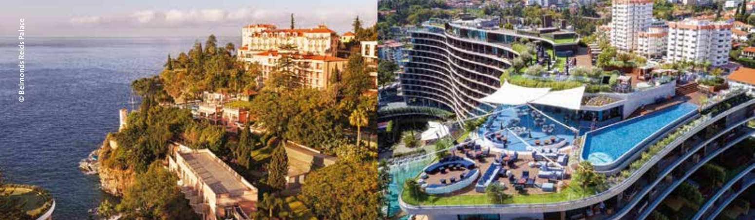
Le Reid's Palace