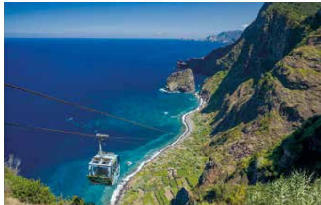
Rocha do Navio - Santana