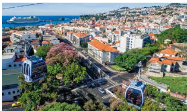
Teleféricos da Madeira