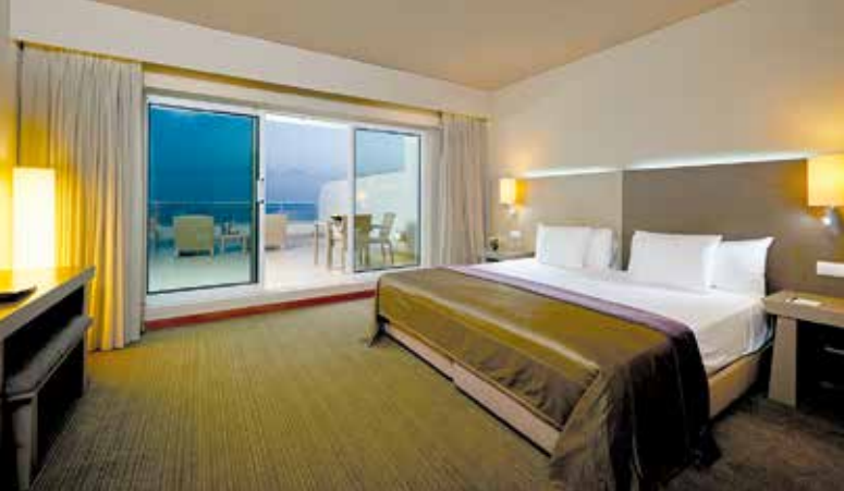
Une suite de l'hôtel Melia Madeira Mare

possède à Madère. Celui-ci jouit d'une belle localisation en bord de mer, à quelques minutes du centre ville, et s'est fait une spécialité de la formule all inclusive encore peu répandue dans l'île. Formule qui s'applique aux groupes Mice, lesquels ont à disposition 8 espaces dédiés aux réunions et aux réceptions couvrant plus de 1300 m 2 (jusqu'à 560 personnes). Toutes les chambres ont été rénovées en 2021, les clients bénéficiant en prime de 3 restaurants, 2 bars, 2 piscines – dont une en intérieur – un spa et une discothèque.