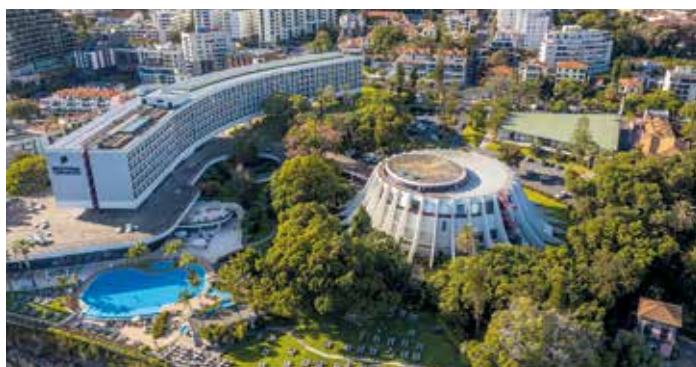
Centro de Congressos de Madeira Pestana Casino Park

Hormis cette structure publique, à Funchal c'est dans les hôtels que l'on recense l'offre la plus pertinente, certains des quatre et cinq étoiles en vue abritant de vrais centres de conférences de grande capacité. À l'instar du Pestana Casino Park, un ensemble dessiné par Oscar Niemeyer qui dispose d'un imposant centre – Centro de congressos da Madeira – doté d'un auditorium de 628 places, de 14 salles de réunion, de deux salles polyvalentes et d'un espace d'exposition. Face à l'hôtel, un casino à l'architecture très spatiale met à la disposition des groupes Mice une salle plénière de 1 000 places, une salle de spectacle de 300 places et plusieurs salles de commission.