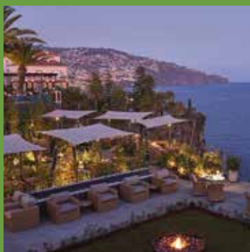
Le restaurant Avista au Cliff Bay