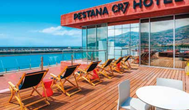
Le rooftop du Pestana CR7 Funchal