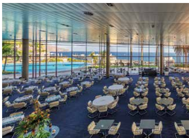
La grande salle de gala de l'hôtel Pestana Casino Park