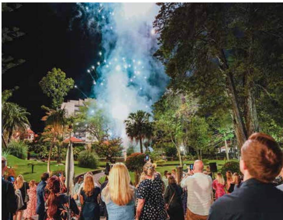
Soirée au parc Santa Catarina

Sur un registre champêtre, concert et cocktail au Parc de Sainte-Catherine à Funchal, une agréable oasis de verdure qui offre une vue imprenable sur le port, également dans le cadre du jardin tropical de Monte Palace , aménagé à la fin du xix e siècle sur le domaine d'une ancienne quinta qui domine la ville et s'agrémente d'un beau musée consacré aux minéraux et à la sculpture contemporaine du Zimbabwe (jusqu'à 300 personnes), ou encore au Parc Quinta Magnólia qui peut accueillir à dîner 80 personnes en intérieur et jusqu'à 350 sous une marquise. En version chic, dîner pour une centaine de convives au Domaine de Palheiro Ferreiro qui s'étire autour de l'hôtel Casa Velha do Palheiro (Relais & Châteaux).