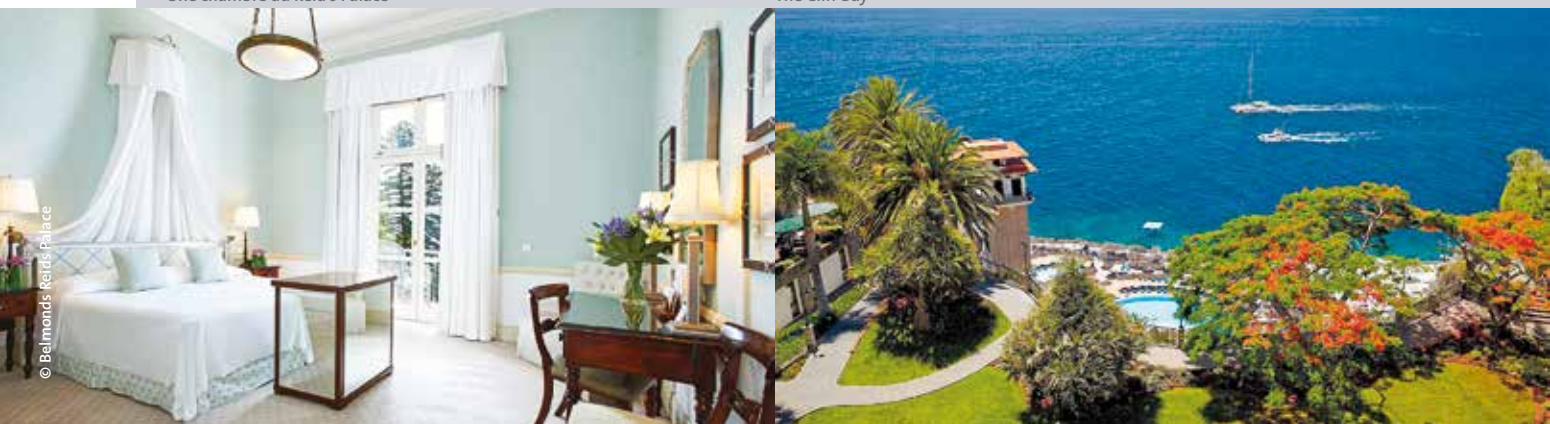
The Cliff Bay