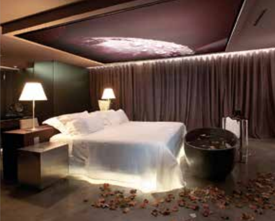
Une suite de l'hôtel The Vine