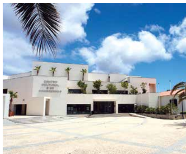
Centro Cultural e de Congressos do Porto Santo

Sur l'île de Porto Santo, à 40 km au nord-est de Funchal, le Centro Cultural e de Congressos , installé dans la capitale Vila Baleira met à la disposition des groupes un auditorium de 300 places, un espace d'exposition, 5 salles de réunion et plusieurs zones polyvalentes.