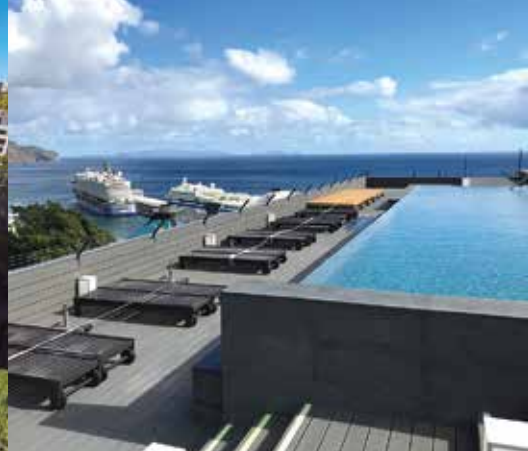
Le rooftop du Pestana Casino Park