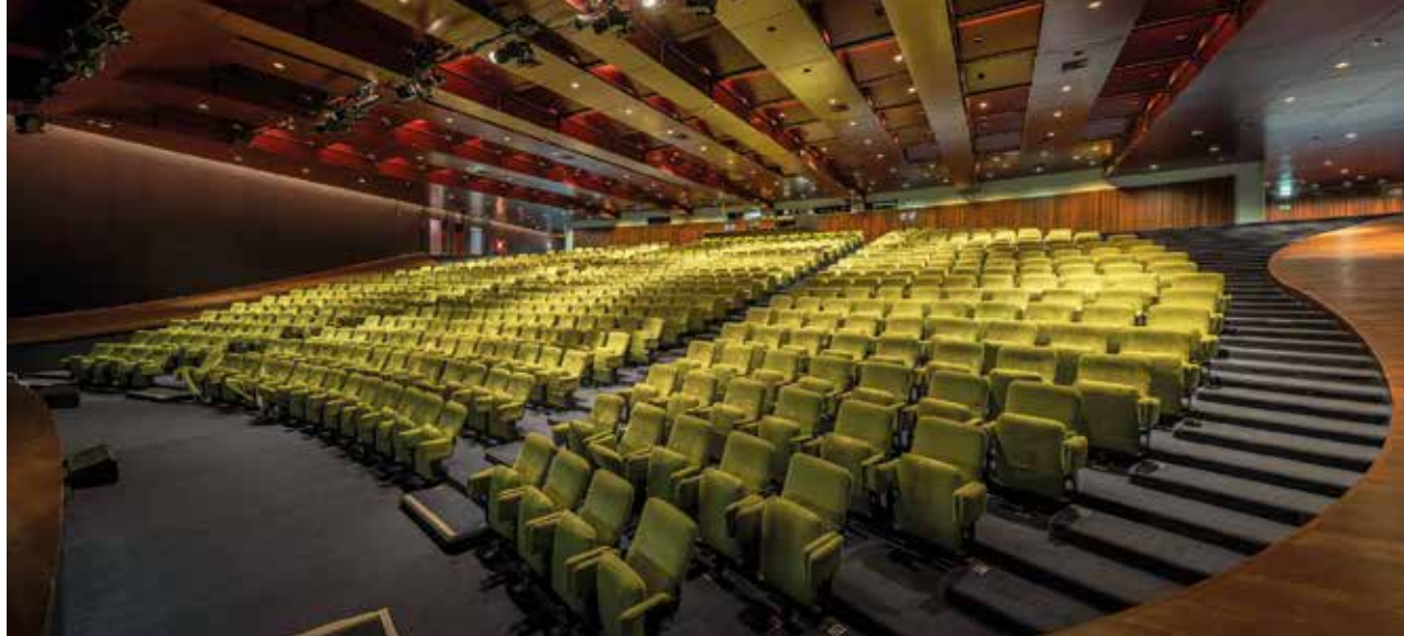
L'auditorium du Centro de Congressos da Madeira