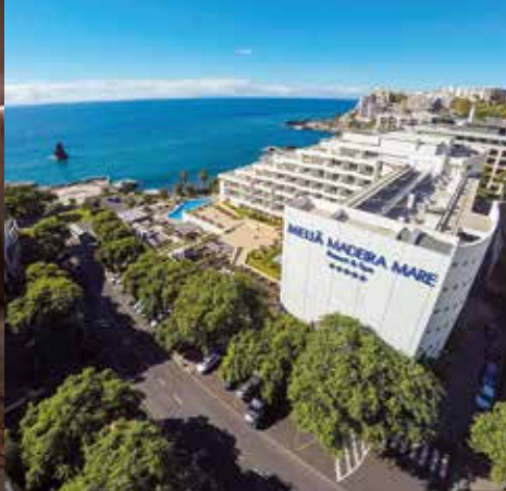
Melia Madeira Mare