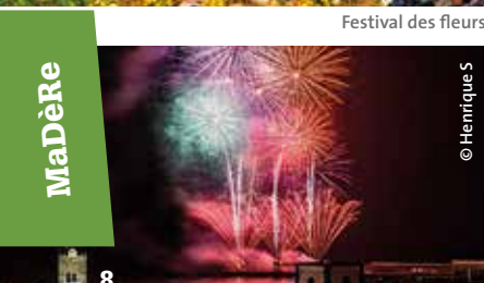
Festival des fleurs