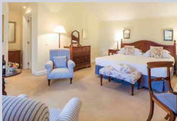
Une chambre du Casa Velha do Palheiro

À quelques mètres de la plage principale, il fait face à l'océan dans un environnement fort reposant idéal pour un séminaire ou à une convention. Un ensemble de caractère qui rend hommage à la production locale de rhum, mise en valeur dans ses espaces publics et au sein de l'exposition permanente qui retrace son histoire, deux zones que l'on peut utiliser pour organiser un cocktail ou un dîner. Chambres spacieuses, 2 restaurants, bar, 2 piscines, rooftop, spa et 5 espaces de réunion (jusqu'à 200 personnes).