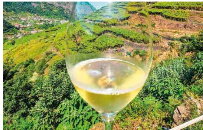
Quinta do Barbusano