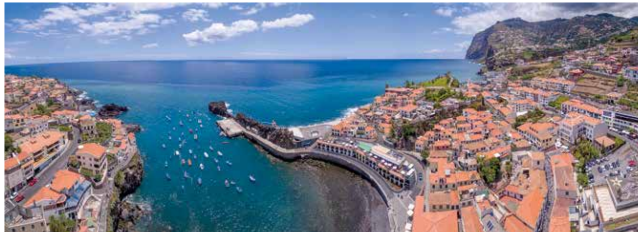
Câmara de Lobos

Guides du voyage : Le petit Futé, Guide du Routard, Michelin.