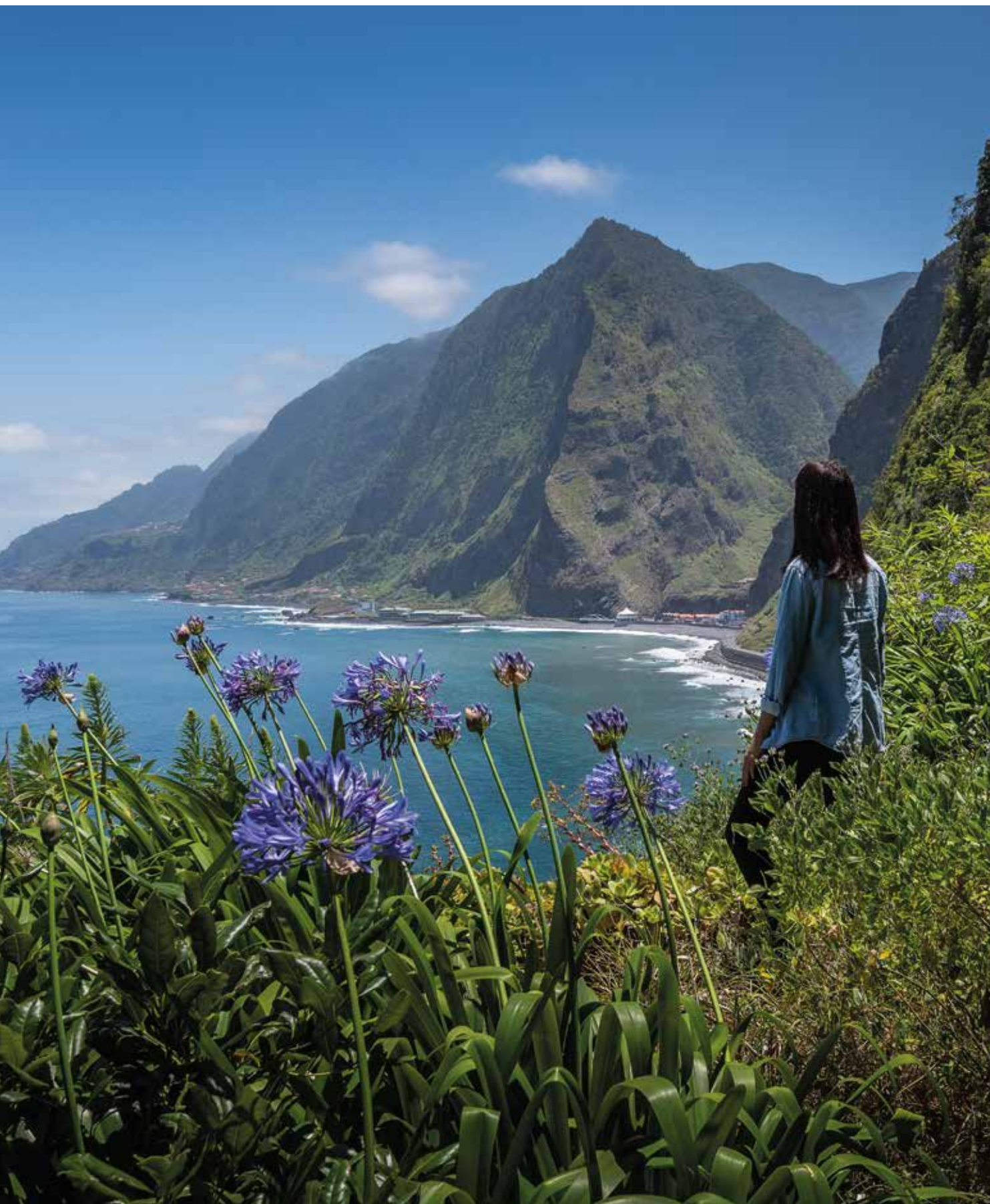
Belvedere São Jorge sur la Boca das Voltas