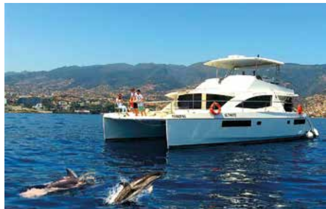
Sortie en mer à la rencontre des dauphins