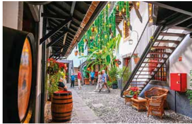
Caves de la maison Blandy's

Sur terre, raid en 4X4 dans l'intérieur de l'île, VTT, running, ascension du Pico do Ariero qui culmine à 1 818 m, saut au Cap Girão, canyoning. Pour les plus chics, compétition de golf sur le magnifique parcours 18 trous aménagé sur les hauteurs de la capitale en marge du Relais & Châteaux Casa Velha do Palheiro ou sur celui de Santo da Serra. On peut également jouer au Porto Santo Golf, sur l'île de Porto Santo, dans la cadre du très chic parcours 18 trous conçu par le champion espagnol Seve Ballesteros. Signalons enfin que Porto Santo – localisée à 40 km au nord-est de la grande île – vaut aussi le détour pour sa belle plage de sable blond de 9 km qui s'étire le long de sa côte méridionale, une rareté dans l'archipel. Un véritable paradis pour le team building.