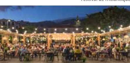
Fête du Vin à Estreit