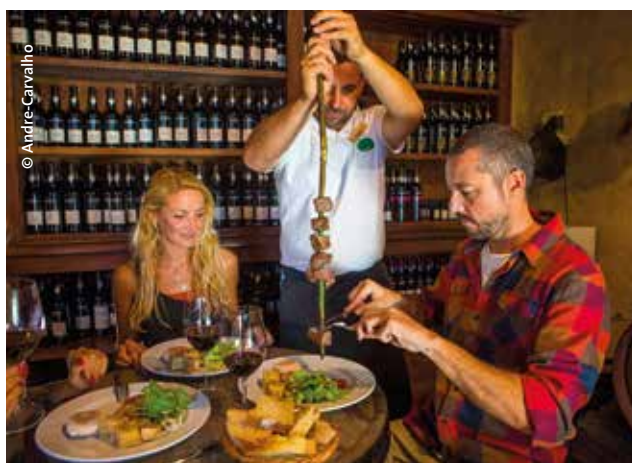
Dégustation de vin au Blandy's Wine Lodge

L'île, bien que de taille réduite, offre beaucoup d'opportunités pour l'organisation d'événements festifs en journée ou en soirée. C'est bien sûr le cas à Funchal où l'on peut avoir accès à des lieux de caractère dans la vieille ville, à commencer par le Mercado dos Lavradores , un marché de fruits et de légumes réputé qui à l'issue d'une visite peut accueillir un dîner de gala de 500 personnes dans la criée aux poissons, du Teatro Baltazar Dias , un joli édifice du XIX e siècle pour une privatisation avec spectacle et un cocktail dinatoire (jusqu'à 400 personnes), de la Forteresse de São Tiago , édifiée au XVII e siècle, qui offre un cadre majestueux pour un cocktail (jusqu'à 350 personnes), des caves de la maison Blandy's , le premier producteur de vin de Madère abrité dans un ancien monastère du XVIII e siècle. Dans ce lieu sublime, 6 espaces peuvent être privatisés pour une dégustation suivie d'un déjeuner ou d'un dîner, notamment dans la salle Max Rommer (jusqu'à