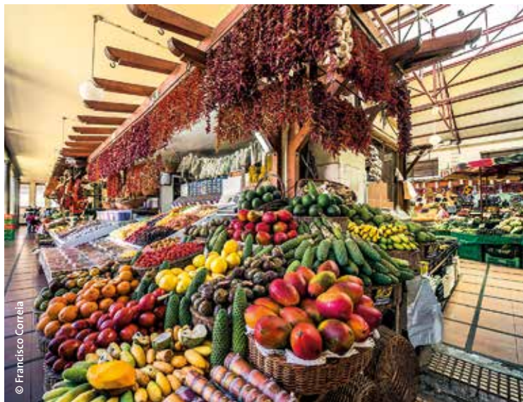
Mercado dos Lavradores

350 personnes). Dans le secteur de la marina, au rez-de-chaussée de l'hôtel Pestana CR7, cocktail au sein du musée CR7 entièrement dédié à l'enfant du pays – Cristiano Ronaldo – (jusqu'à 150 personnes). Au Casino de l'hôtel Pestana , soirée jeux avec spectacle dans les deux espaces dédiés à l'événementiel (300 et 1000 places).